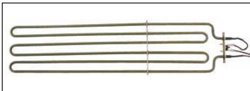
Dodatečný elektrický ohřívač